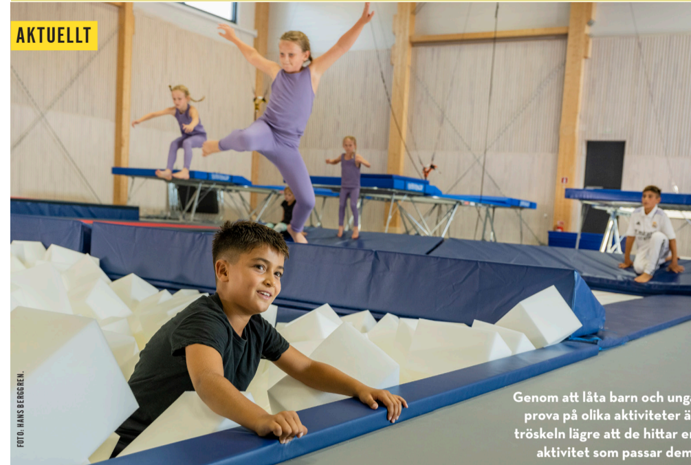
Genom att låta barn och unga prova på olika aktiviteter är tröskeln lägre att de hittar en aktivitet som passar dem.