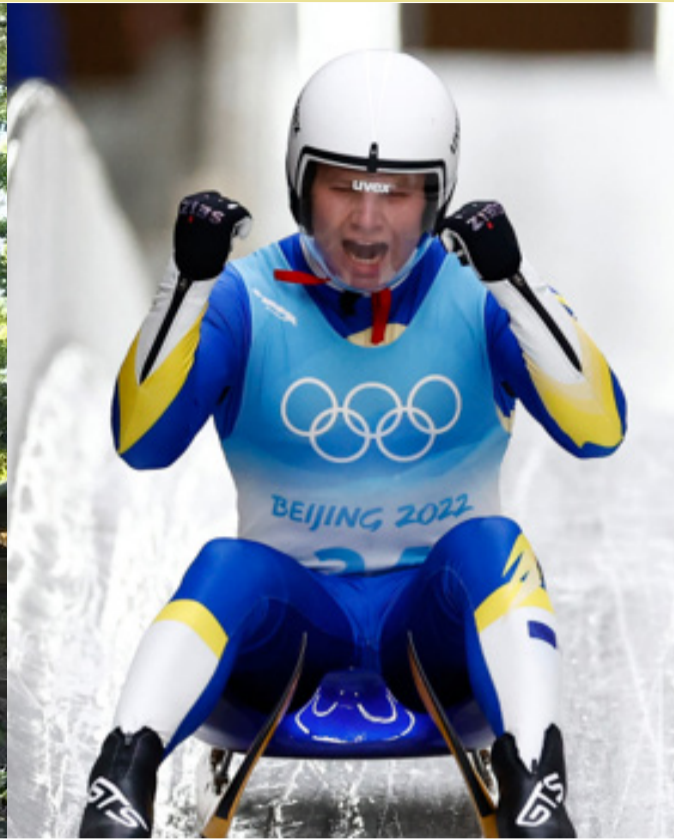
Visste du att i Österåker finns en rodel- och källklubb som tagit sig hela vägen från en hemmasnickrad bana på Ljusterö till OS i Peking?